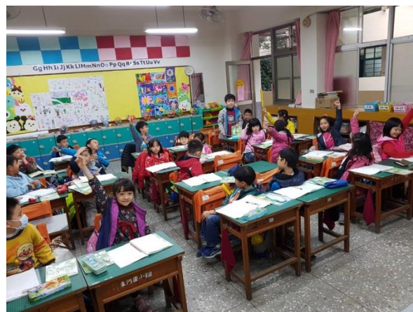
照片說明：選舉班上最像超人爸爸和超人媽媽的