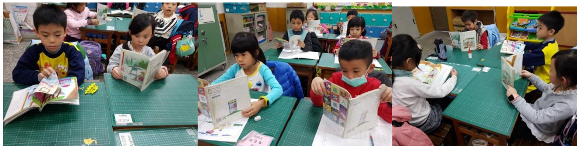
照片說明：閱讀超人媽媽、超人爸爸專書

若為班級教學活動：請以班級為單位，每班提供兩張照片；若為學年活動：請以學年為單位總提供 4 張照片。