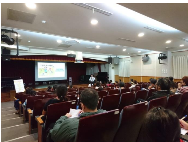
以一首「王老先生有塊地」的兒歌，生動說明親師溝通如何產生落差。