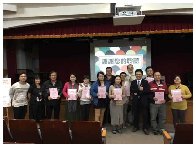
『全勤獎』頒獎時刻：以上為全程參加四場次親職講座的家長們，感謝您們的用心與投入。