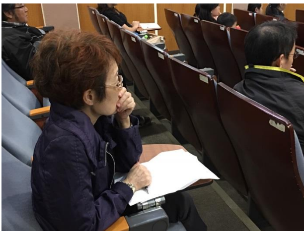
過程中家長全神貫注的樣子。