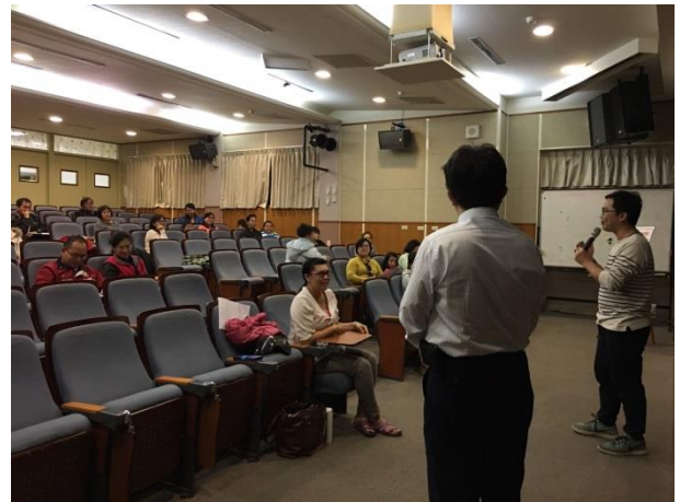
輔導主任開場引言。