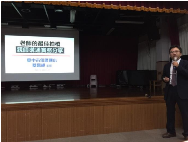
講師：蔡昌樺主任，這是他第 232 場演講。