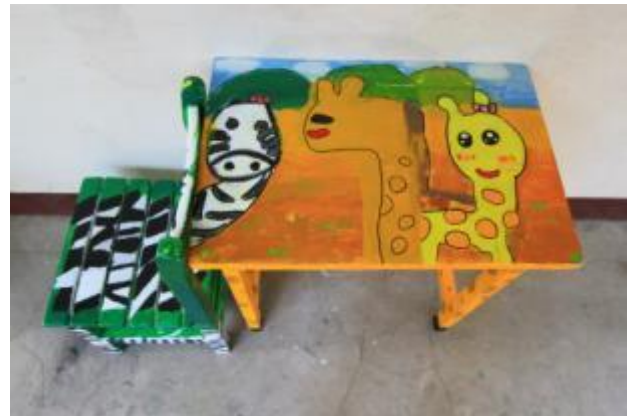
彩繪桌椅運用聯想力就有很棒的火花出現!