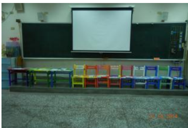
小組一起合作的彩繪桌椅

如何帶領孩子進行繁瑣的工作，也是一門學問。在十週彩繪桌椅歷程中，跟著學生一個步驟一個步驟做，這才發現只要規劃得宜，不一定要太多示範，學生透過小組合作還是可以創造出令人驚豔的作品。