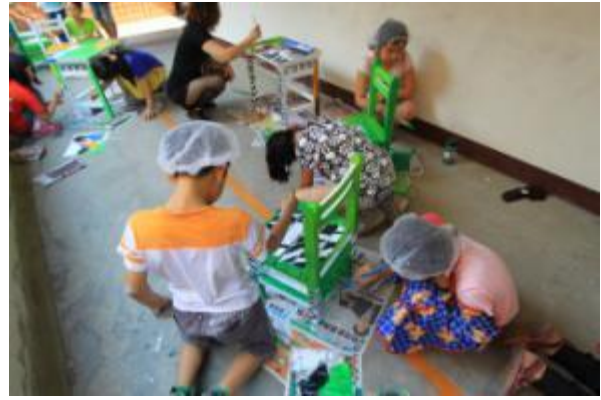
藝術創作-彩繪桌椅