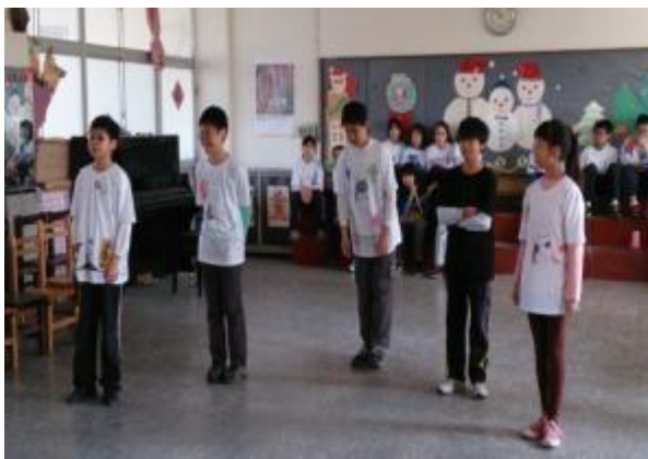
↑七間的音樂專科教室，各班在學期末時會辦理音樂發表會，讓孩子有表演的舞台。