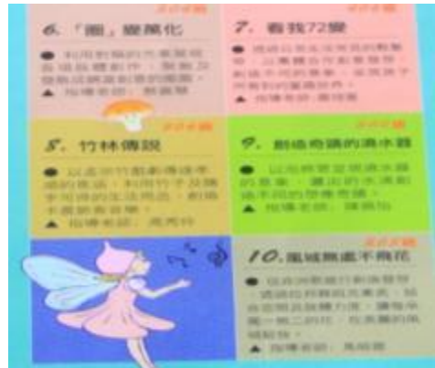
閱讀一條河流之展演宣傳單