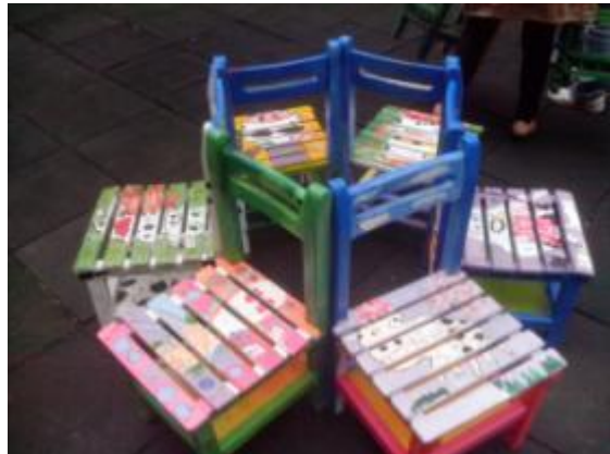
校園也有彩繪的小小空間