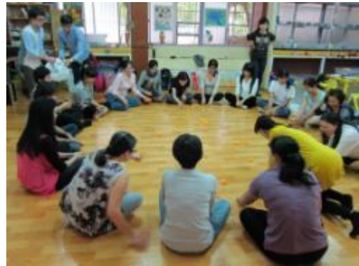
週三教師成長活動

2、培養人與環境關懷的精神：校園裡有一些古老的動物雕像，陪伴著一屆又一屆的學生度過無數童年的青澀歲月。然而隨著時間的遞嬗，這些動物雕像在校園裡漸漸失去的光彩，隱藏於角落裡。想配合春天節氣萬物煥然一新的概念，藉由藝術與人文及國語文的課程，幫動物們換上藝術的新衣，同時也在動物們身上找到律動的元素與靈魂。在春季的東門校園裡，來一場孩子與動物的展演活動。