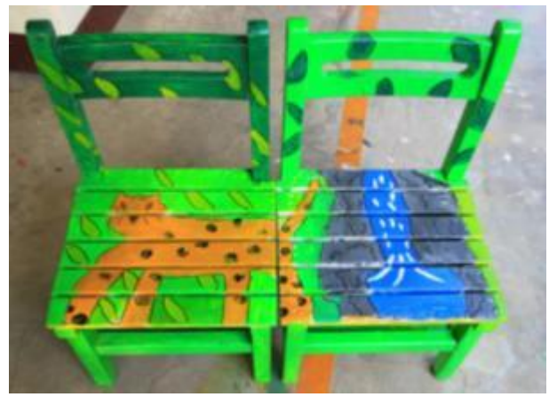
每一張彩繪桌椅都有他背後的故事