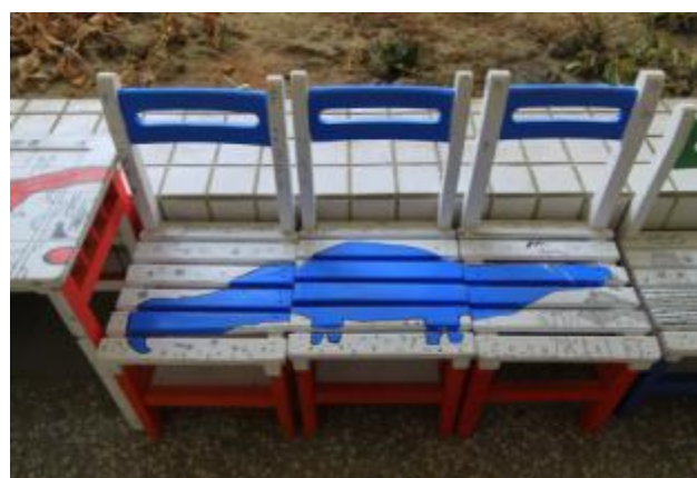
合體的桌椅，讓欣賞者驚嘆不已