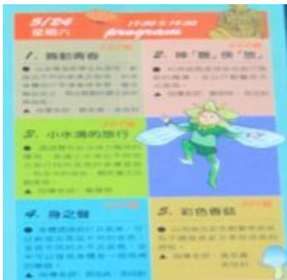
閱讀一條河流之展演宣傳單