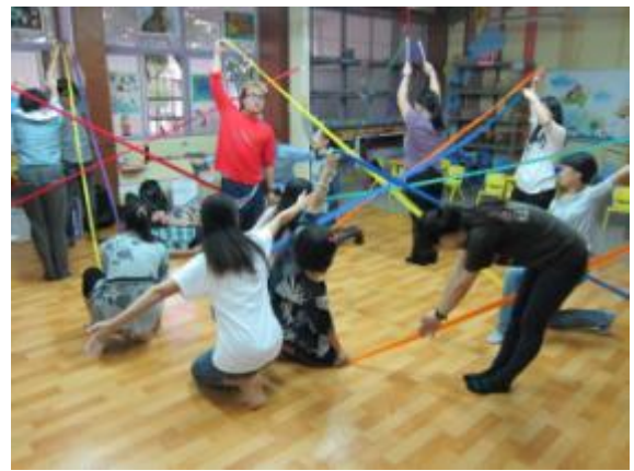
↑玩具圖書館亦有木質地板，可供教師表藝課程研習使用。