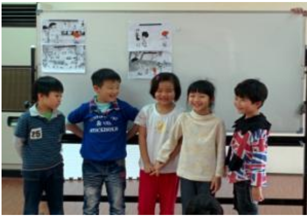
孩子根據自己創作的作品作發表