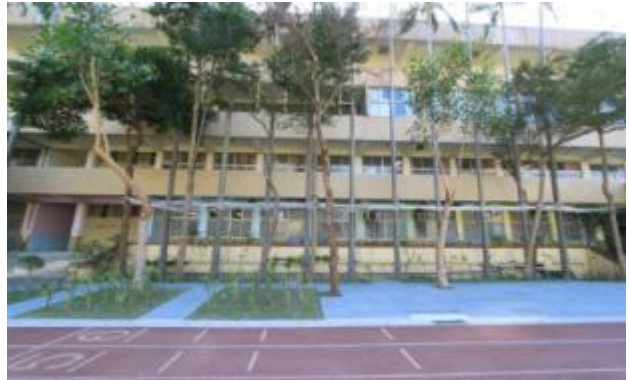
美化後的校園環境