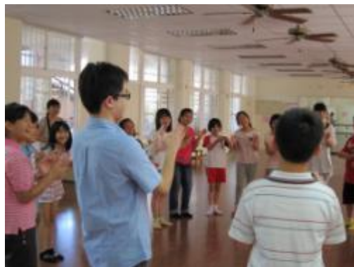
透過肢體展演發現人我關係

四、學生打開藝術的觸角後，對學習環境的美化，學校推展的藝術活動，例如”生活有藝思”、”閱讀一條河流”、”劉其偉畫展”等，都懷抱濃厚興趣，所以如何讓藝術課程遊戲化、敢動手去改變並落實在生活中，是今後教學必須多關注的地方。