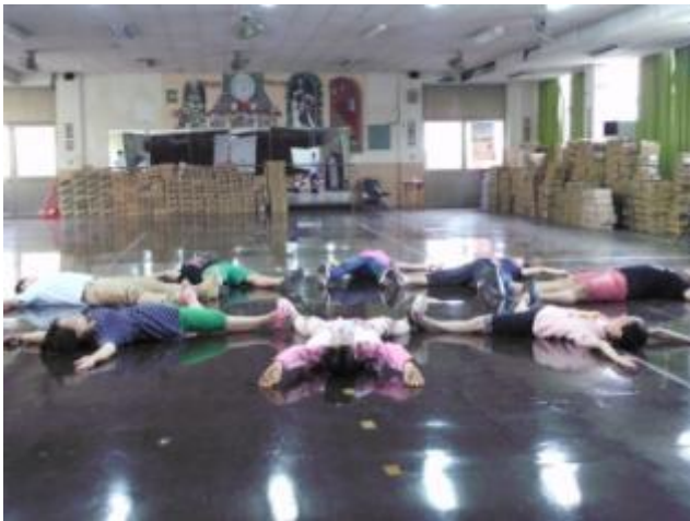
↑人數眾多時，可使用活動教室，辦理教師相關藝文增能，或是合班上課時可使用。