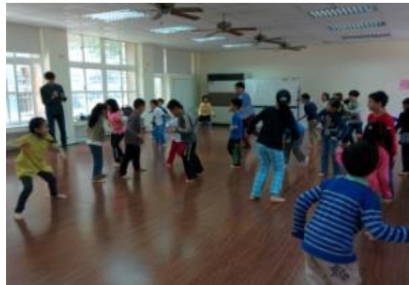
透過肢體探索就能讓孩子心緒沉靜