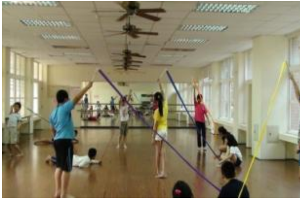
↑專業設備齊全的韻律教室，非常適合發展表藝課程。圖為藝教於樂上課情形，高低水平肢體展現與彩帶結合為美麗的樂章。