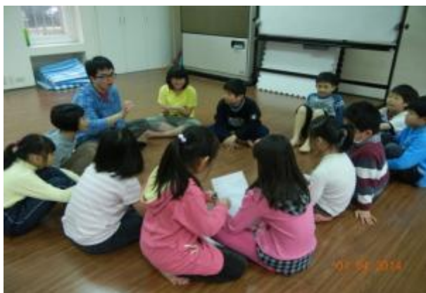
律動創意正在萌芽

配合著音樂，孩子的想像力可以無遠弗屆，過去我們都將「藝術」視為一種專家才能勝任的活動，但從觀課過程中，我們發現，簡單的音樂，便可以發展孩子的律動創意。