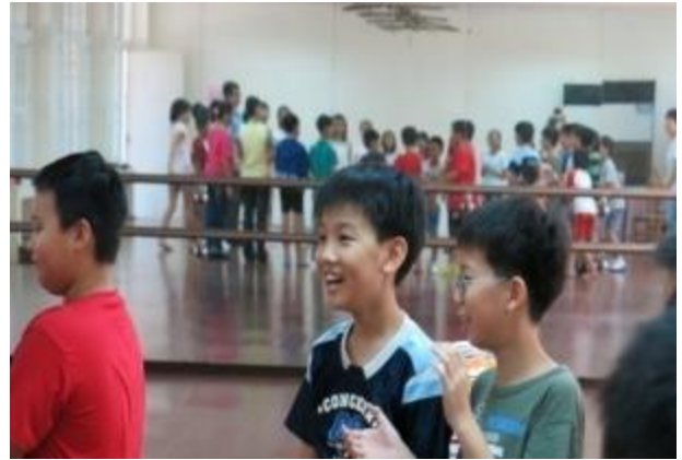
↑孩子在明亮寬敞的韻律教室，學習節奏律動與藝術創作。