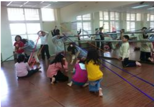
每一次的上課都有不同的火花