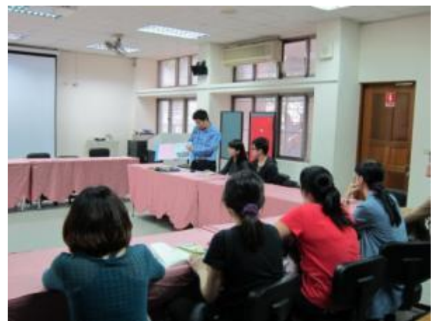
↑藝術家與老師共同備課與實作，方能將能力留給老師，使老師在表藝的教學精進。