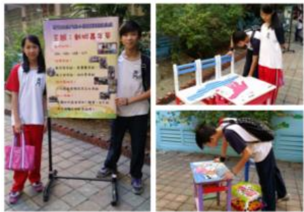
戶外展示讓全校師生都有機會接觸藝術