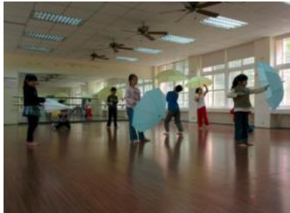
為了戶外展演學生們正努力練習著呢