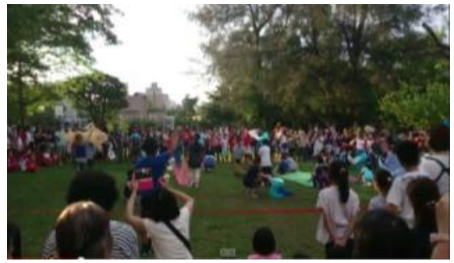
戶外展演課程-閱讀一條河流